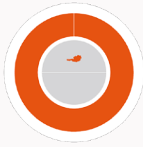
Herkunft der Nachweise

87,43 % Wasserkraft 12,57 % Sonstige erneuerbare Energieträger